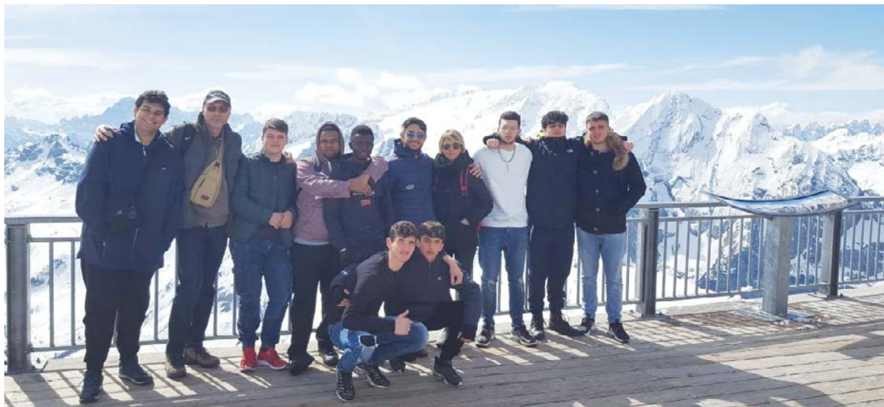
Il gruppo di allievi elettricisti sulla Marmolada