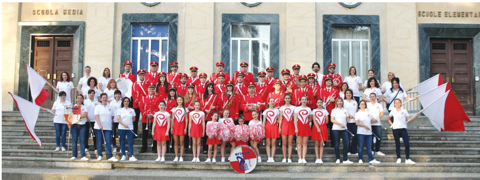
La banda al completo con la nuova divisa e le majorettes

Borgonovo, 15 giugno 2019, un grande evento per il Gruppo Musicale Orione, un grande evento per il paese. Una volta l'anno è ormai usanza che le bande della Provincia di Piacenza si incontrino, a turno, in un Comune sede di banda. Quest'anno era la volta di Borgonovo. Anche chi cammina per strada senza leggere i manifesti, chi non vuole sapere i fatti del paese, non poteva non accorgersene. La sera di quel sabato, da vari punti di Borgonovo, sono partite le bande con le rispettive majorettes. Si sono uditi dapprincipio suoni di tamburi, si sono viste gambe marciare, gonnelline svolazzare, e, poco dopo, si sono sentite le prime note, le prime marce, le prime canzoni che attraversavano le strade, per raggiungere la Rocca. E anche gli spettatori hanno accompagnato musicanti e ballerine, passeggiando per il paese, per poi fermarsi sulla piazza.