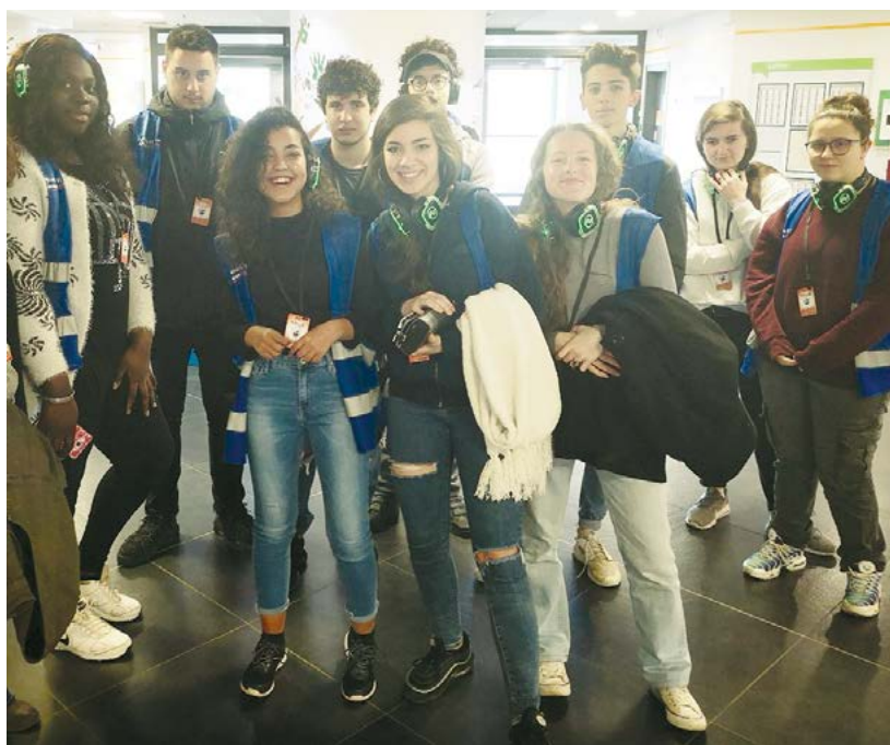
Alcuni allievi della classe 2 a del Corso di Operatore Grafico presso la sede di Amazon

Per la nostra scuola rappresentano davvero uno strumento utile: i kindle saranno utilizzati dagli insegnanti durante le lezioni e gli stessi allievi potranno prenderli in prestito per avvicinarsi, speriamo, sempre più alla lettura.