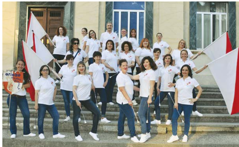
Le ex-majorettes a “Bandalarga”