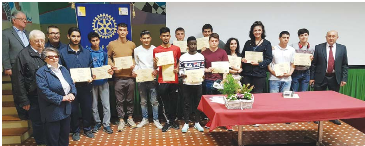
Gli allievi che hanno ricevuto le borse di studio