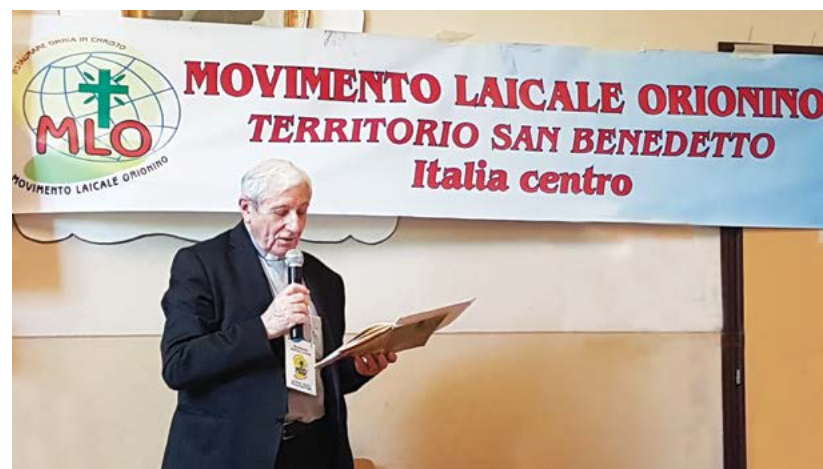
Don Erasmo Magarotto

Secondo la leggenda questa immagine, dipinta su di una semplice asse di legno, arrivò a Bologna grazie ad un eremita greco. Egli, entrato per pregare a Santa Sofia di Costantinopoli