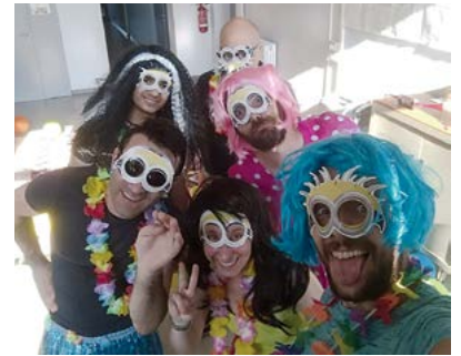
Gli animatori della comunità

Lo scopo della nostra presenza non è stato di solo svago e divertimento da donare ai piccoli della scuola d'infanzia ed alle loro famiglie, ma, ancora una volta, e soprattutto grazie alla presen-